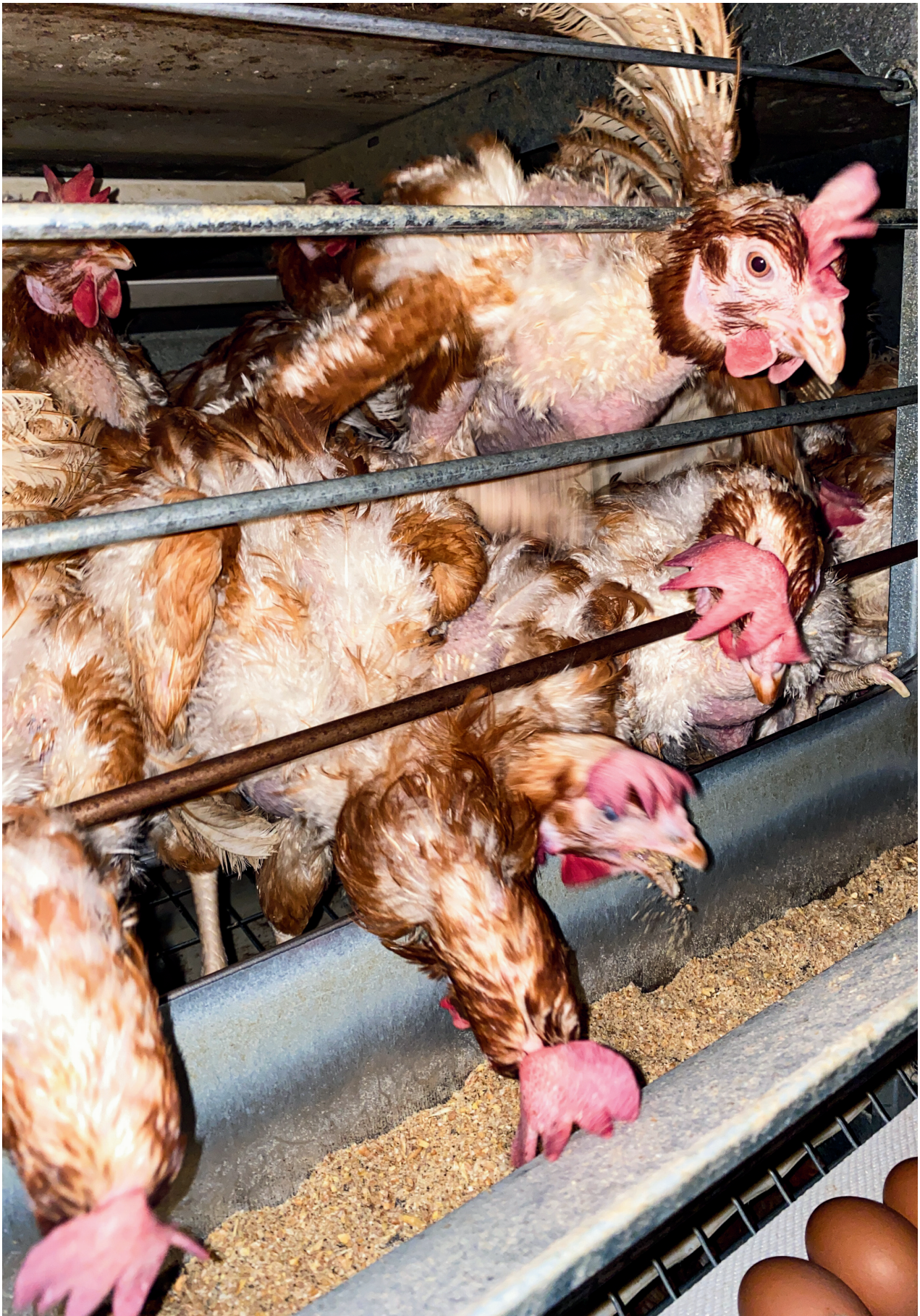
Puuris on igale kanale seadusega ette nähtud ligikaudu A4-suurune ala.