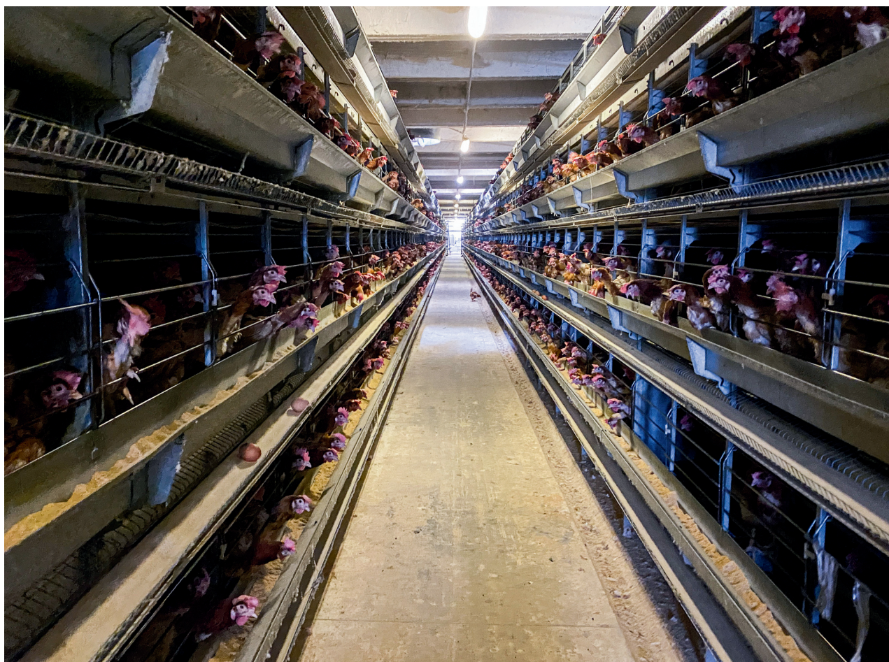
Ühes puurikanala hoones on koos kümned tuhanded linnud.

2023. aasta septembris avaldas loomakaitseorganisatsioon Nähtamatud Loomad salaja filmitud kaadrid kolmest suurimast munatootmisfarmist Eestis. Sellega koos avati rahvaalgatuslik petitsioon kanade puurispidamise keelustamiseks, mis kogus 2024. aasta 17. jaanuariks 21 421 digiallkirja, mis esitati Riigikogu esimehele. Arutlused puurispidamise keelustamise üle kestavad Riigikogu maa-elukomisjonis.